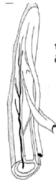
tetive prvog i drugog članka prstiju